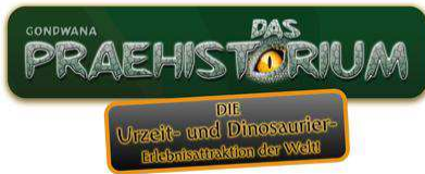
Gondwana – Das Prähistorium www.gondwana-praehistorium.de