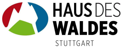
Haus des Waldes www.hausdeswaldes.de/