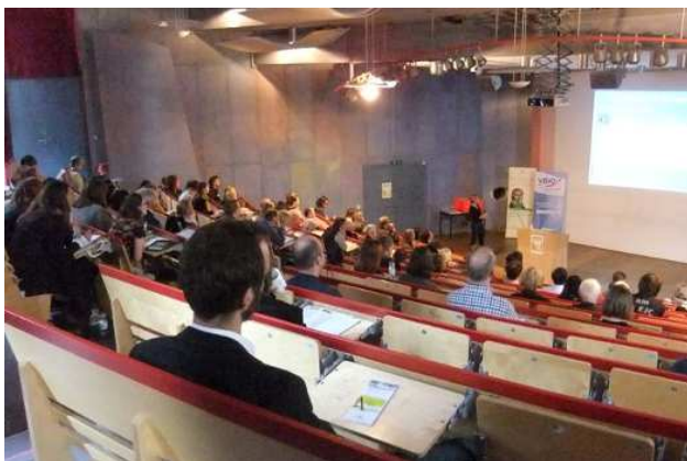
Voller Hörsaal beim Landesbiologentag