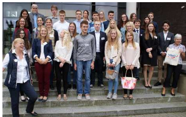
Die Preisträger 2016 aus NRW

Am Montag, dem 27. Juni 2016 erhielten 42 Bio-Abiturienten in NRW den Karl von Frisch-Abiturientenpreis. Am Max-Planck-Institut in Dortmund fand zu diesem Zweck ein informativer und feierlicher Nachmittag statt.