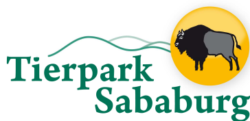
Tierpark Sababurg, Hofgeismar www.tierpark-sababurg.de/