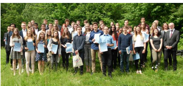
Die Karl von Frisch-Preisträger 2016 aus Hessen

Am 11. Juni 2016 verlieh der Landesverband Hessen in Marburg die diesjährigen Karl von Frisch-Abiturientenpreise. Die Preisträger, ihre Familien, Freunde und Lehrer, insgesamt etwa 200 Personen, erlebten eine gelungene Veranstaltung mit spannenden Vorträgen zu aktuellen biowissenschaftlichen Themen, Laborführungen und einem „Meet and Greet“, bei dem die Abiturienten Biowissenschaftler und ihre aktuellen Berufe kennenlernen konnten.