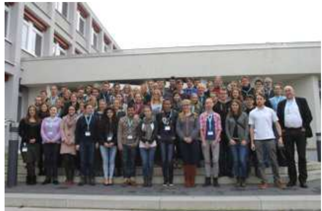
ESCH 2016 in Hamburg

gie, Tissue Engineering, Knock-Sideway Gene Editing, lichtinduzierte Schaltsysteme in Zellen oder über künstliche Organe auf Mikrochips. Aber auch Tiefseerobotik oder die neuesten Entwicklungen in der RNA-Virologie standen auf dem Programm. Den wissenschaftlichen Höhepunkt stellte der Vortrag des Nobelpreisträgers Stefan Hell dar, der eine Einführung in die STED-Mikroskopie bot. Die Studierenden hatten während des abschließenden Konferenz-Dinners die Möglichkeit Kontakte zu knüpfen und sich über die neuesten Themen in der Biologie auszutauschen