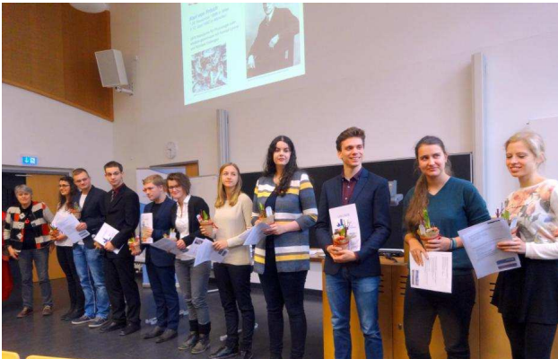
Die Karl-von-Frisch-Abiturientenpreisträger 2016 aus Sachsen.

Die Landesverbände im VBIO vergeben alljährlich Karl von Frisch-Abiturientenpreise für die besten Biologie-Abiturientinnen und Abiturienten. In 2016 haben zwölf Landesverbände an über 300 Schülerinnen und Schüler Karl von Frisch-Abiturientenpreise vergeben.