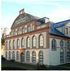
Naturkundemuseum Kassel www.naturkundemuseum-kassel.de