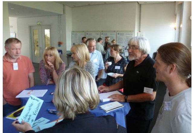
Die Teilnehmer der BDV diskutieren über Aktionen und Ideen zum Jubiläumsjahr 2017.

Die diesjährige Bundesdelegiertenversammlung (BDV) des VBIO fand am 16. September in Frankfurt statt. Die Agenda war gut gefüllt: Neben Kurzberichten zu Aktivitäten und Finanzen standen turnusgemäß auch Wahlen auf dem Programm. Im Mittelpunkt standen jedoch die Satzungsreform sowie ein Ausblick auf das „Jubiläumsjahr“ 2017, in dem der VBIO zehn Jahre besteht. Zehn Jahre, in denen der VBIO in den Bereichen Ausbildung, Studium und Karriere sowie „Wissenschaft und Gesellschaft“ eine Vielzahl von Aktivitäten entwickelt hat, in denen aber auch die Begrenztheit der finanziellen und personellen Ressourcen immer wieder deutlich geworden ist. Wie also kann das Jubiläumsjahr genutzt werden, um dazu beizutragen, den VBIO finanziell zu stärken, die Anzahl und das Engagement der Mitglieder zu erhöhen sowie Sichtbarkeit und Attraktivität des VBIO zu verbessern? Diese Fragen wurden in verschiedenen Diskussionsrunden beleuchtet.